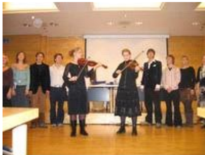
Bildetekst: Romerike Folkehøgskole stod for et flott kunstneriks innslag